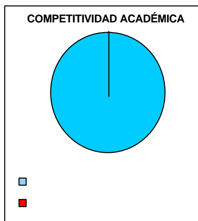
Figura 2 Competitividad académica

La DES de Psicología cuenta con un PE acreditado en el nivel I de los CIEES con 100% de la matrícula atendida en programas de buena calidad.