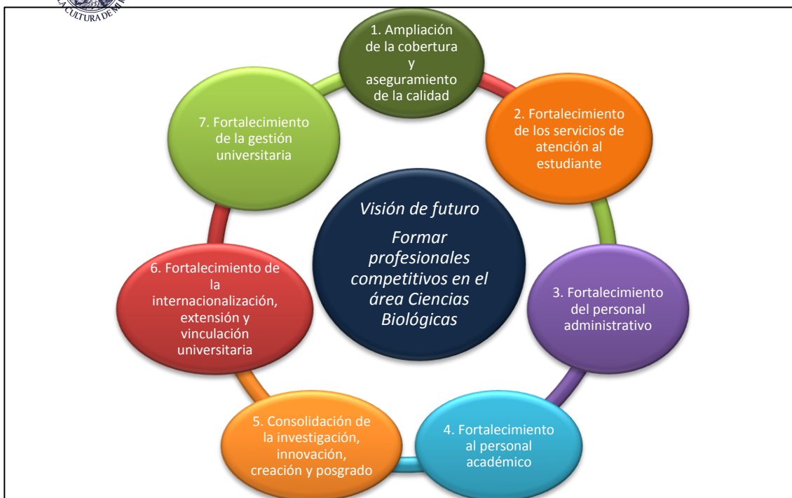
Figura 2. Diagrama de Ejes Estratégicos de la UNICACH de acuerdo al Plan Rector de Desarrollo Institucional.